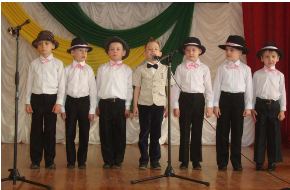
Воспитанники детских садов поздравили воспитателей с профессиональным праздником