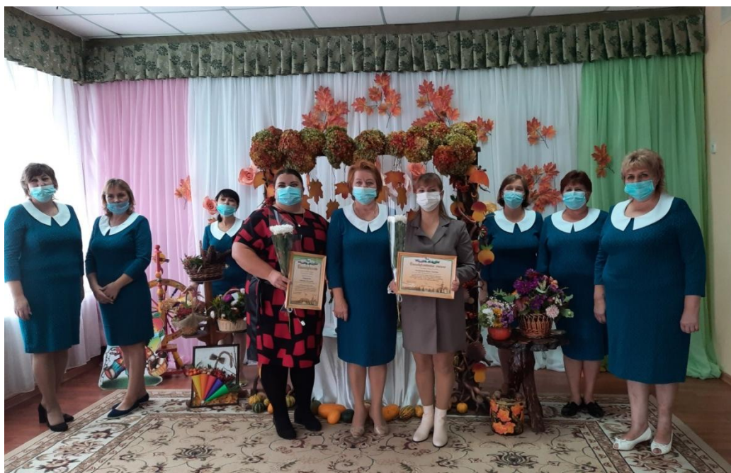
Награждение работников дошкольных образовательных учреждений

К празднику дошкольные учреждения оформили выставки осенних композиций на тему «Прекрасной осени мотивы...», фотографий на тему «Мое призвание - воспитывать детей». Украшением праздников стали музыкальные номера, подготовленные воспитанниками детских садов.