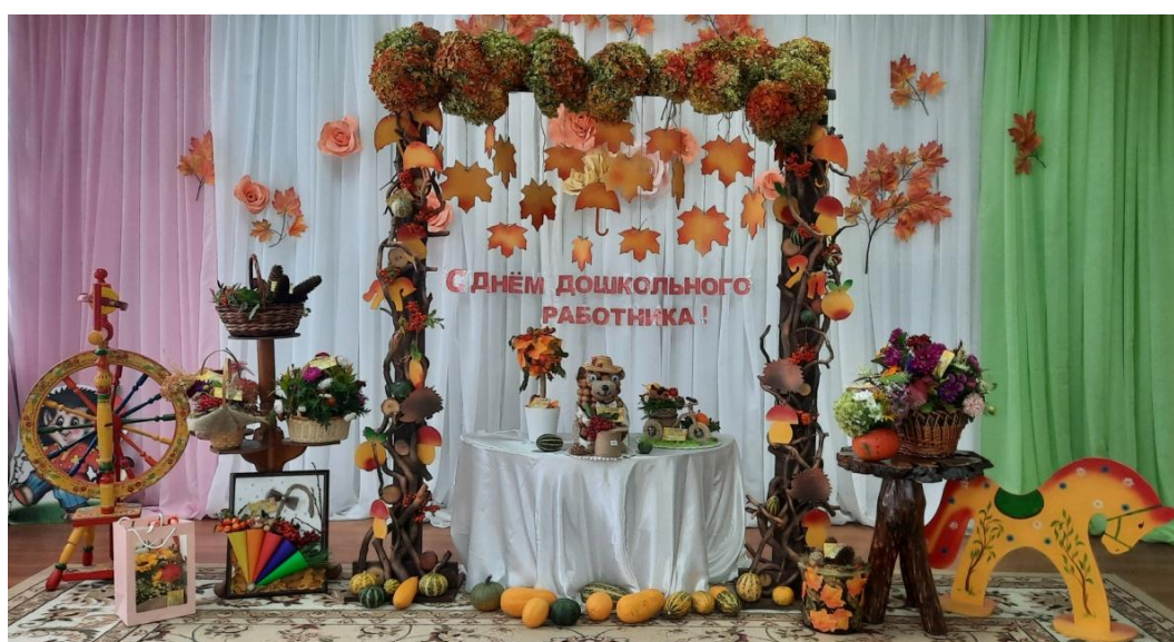
Выставка осенних композиций на тему «Прекрасной осени мотивы...»

Одним из важнейших мероприятий ноября стало участие педагогического сообщества района во втором Белгородском Образовательном салоне «Инновации в дошкольном образовании» в формате видеоконференцсвязи. Мероприятия салона были посвящены актуальным направлениям развития системы дошкольного образования региона: