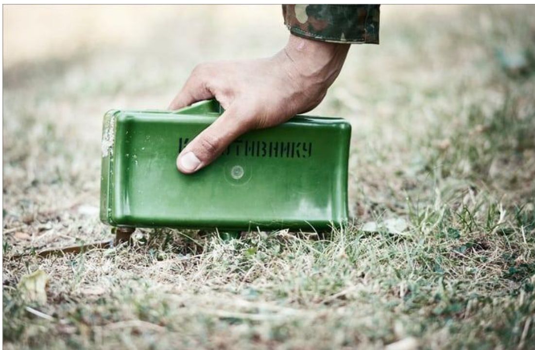
Мина в боевом положении