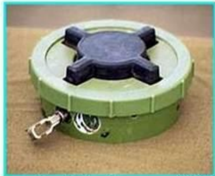
Рис.1 Общий вид мины ПМН-2

ПМН-2 Противопехотная мина нажимного типа